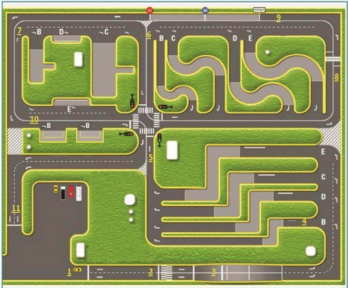
B2 - F ယာဉ်မောင်းလိုင်စင်အတွက် လက်တွေ့မောင်းနှင်ရမည့် လမ်းကြောင်းပုံစံ

နှုန်းသတ်မှတ်ချက်ဖြင့်မောင်းနှင်ခြင်း၊ အပြိုင်ယာဉ်ရပ်နားခြင်း (Parallel Parking) စသည့် နေရာများတွင် မောင်းနှင်ခြင်းများအား အောက်ဖော်ပြပါအတိုင်း ဖြေဆိုရမည်ဖြစ်ပါသည်။