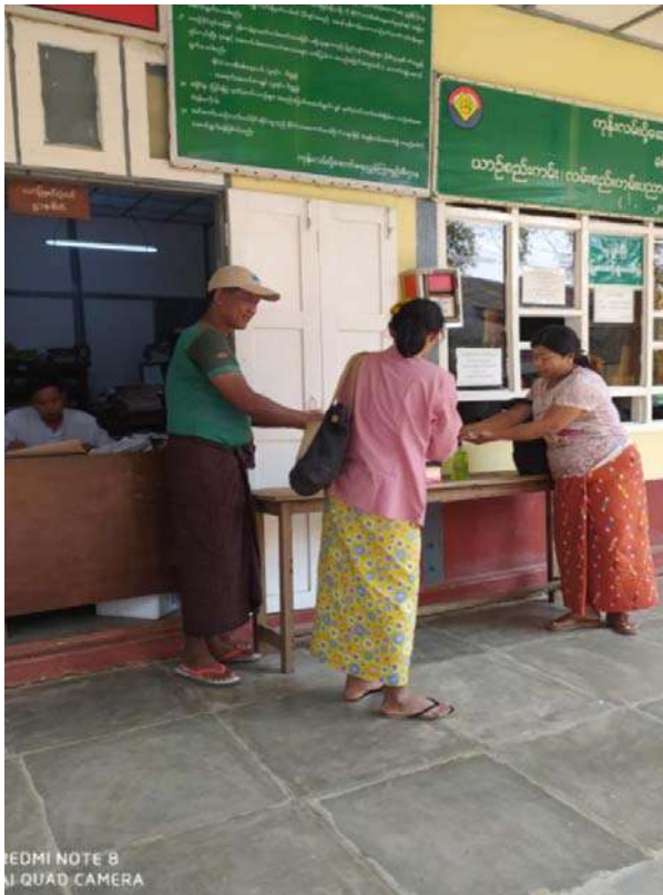
ယာဉ်မှတ်ပုံတင်ဌာန/ငွေစာရင်းဌာနရှေ့နေရာ