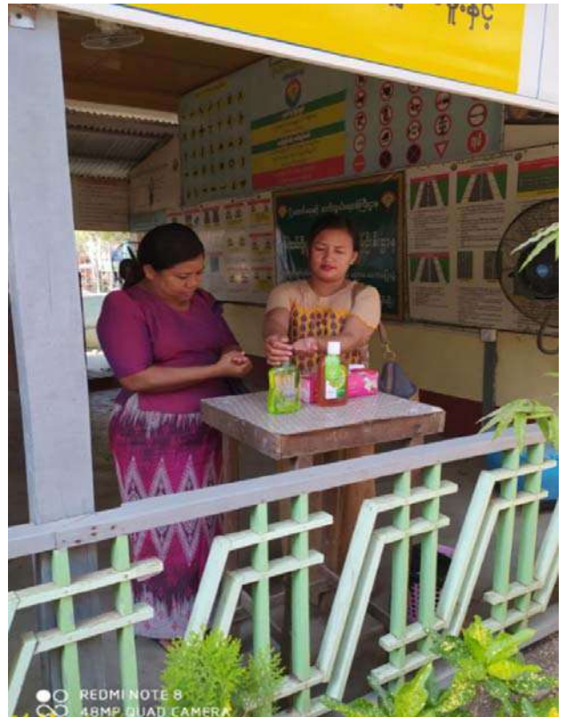
ယာဉ်မောင်းစစ်ဆေးရေးသင်တန်းခန်းမနေရာ