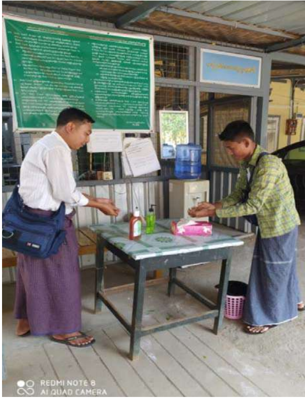
ယာဉ်စစ်ဆေးရေးဌာနရှေ့ပုံစံရယူရန်နေရာ

ကိုရိုနာဗိုင်းရပ်ရောဂါ(COVIC-19)ရောဂါပြန့်ပွားမှုမဖြစ်အောင်ကြိုတင်ကာကွယ်ရန် ဆောင်ရွက်ထားရှိမှုမှတ်တမ်းဓါတ်ပုံများ