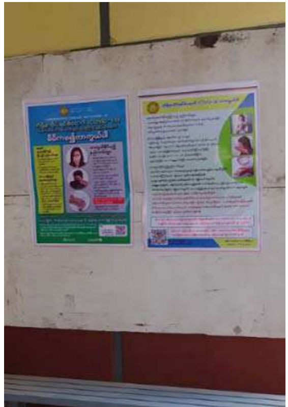
နားနေဆောင်တွင်းဗီနိုင်းထားရှိမှု