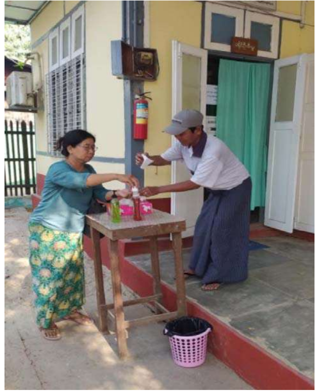
ခရိုင်ဦးစီးမှူးအခန်းရှေ့နေရာ