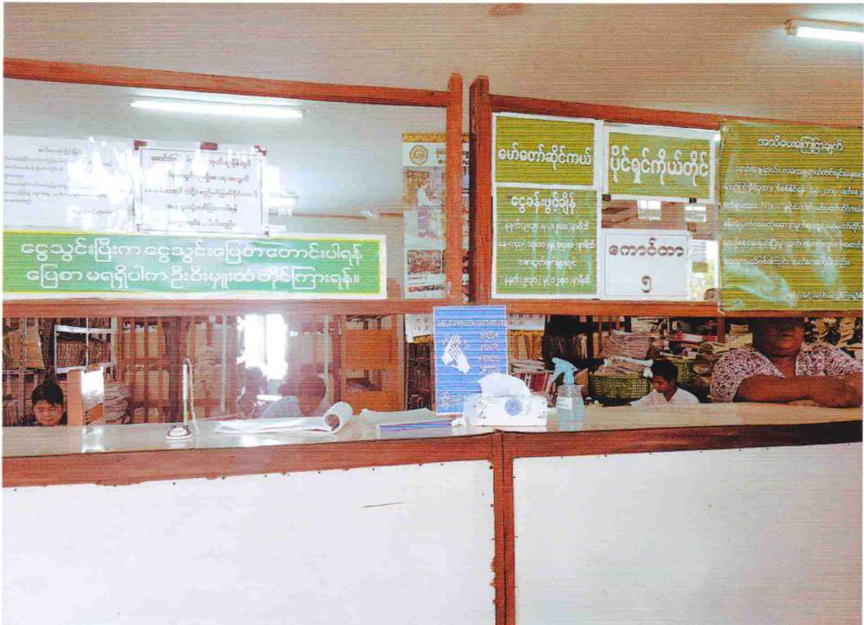
က.ည.န၊ နေပြည်တော်ရုံး၏ ကောင်တာများတွင် ရေမလိုလက်သန့်ဆေးရည်ထားရှိပုံ