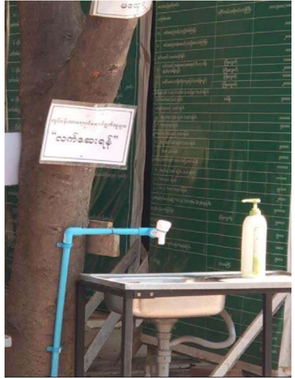
နားနေဆောင်ရှေ့နေရာလက်ဆေးကန်