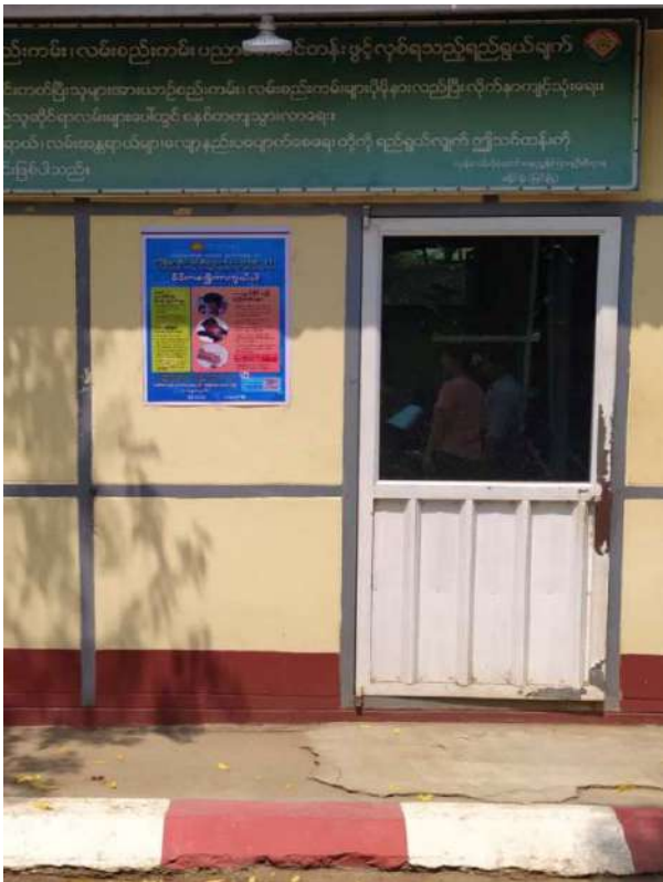
ယာဉ်မောင်းစစ်ဆေးရေးခန်းမရှေ့ဗီနိုင်းထားရှိမှု